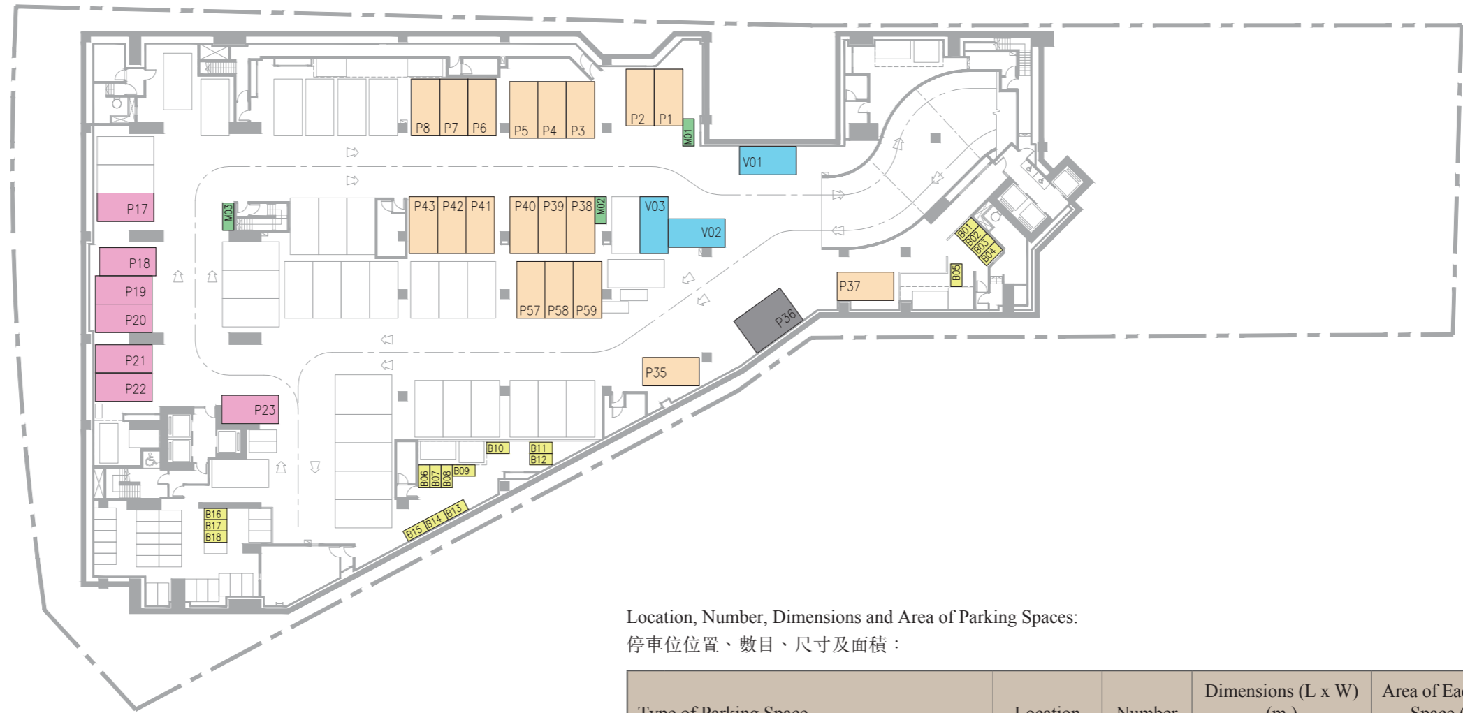
Location, Number, Dimensions and Area of Parking Spaces: 停車位位置、數目、尺寸及面積：